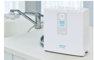
電解水素水整水器 トリムイオンHYPER

（※2）トリムイオンHYPERを使用し、1日21リットルを5年使用した時の500mlあたりの単価（カートリッジ・電気代・水道代含む）