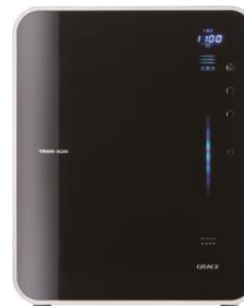
電解水素水整水器トリムイオンGRACE 医療機器製造販売認証番号：229AGBZX00069000

日本トリムの電解水素水整水器は、水道水に含まれる塩素や鉛など19種類の不純物を浄水し、さらに電気分解してアルカリ性で水素を含んだ電解水素水を生成する器械です。この器械は、胃腸症状の改善効果が認められた管理医療機器です。