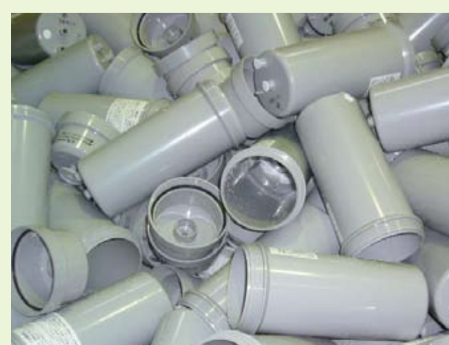
プラスチック部分

← サーマルリサイクルへ。RPF固 形燃料へと生まれ変わります。 CO 2 排出が少ない次世代燃料 です。