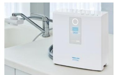
家庭用電解水素水整水器 トリムイオンHYPER

電解水素水整水器とは、水道水に含まれる塩素や鉛などの不純物を浄水フィルターに通して除去し、その水をさらに電気分解した、抗酸化性のある水素を豊富に含んだアルカリ性の水を生成する器械です。家庭用電解水素水整水器は胃腸症状の改善に効果・効能のある家庭用管理医療機器として認証されています。