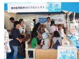
昨年の足水の様子

肌と同様の弱酸性水を使用した“弱酸性水の足水”を設置し、足を冷やして熱中症を予防しながらひと涼みしていただけるブースです。足水の際には、飲み水として電解水素水をご提供するため、二種類の水を同時に体感いただける貴重な機会になっています。