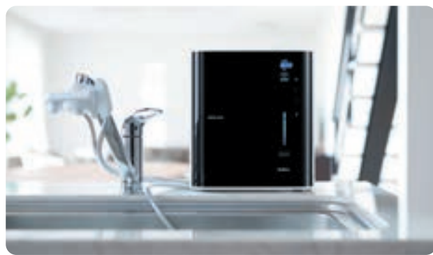
2021年6月発売:TRIM ION Refine

2021年6月、最上位機種「TRIM ION GRACE」の低価格仕様・コンパクト版の「TRIM ION Refine」を新発売しました。高スペックの整水器が各段にお買い求め安くなったと大変好評いただいております。現在では直販商品の80%以上を占めております。また、2021年7月にはWEB専用商品「TRIM ION CURE」の新色「プラチナグリーン」、「シャンパンゴールド」を発売しており、今後はコロナ後の消費拡大を見据え、さらなる製品開発と営業展開の強化につとめてまいります。