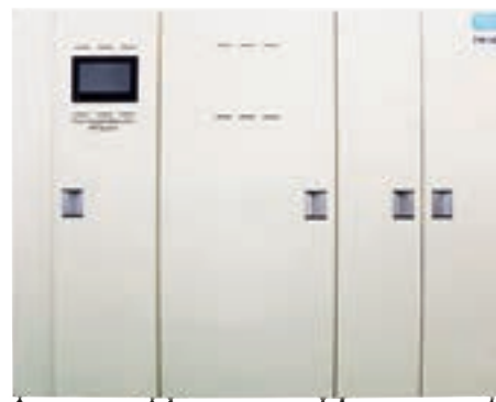
多人数用透析用水作製装置EW-SP75シリーズ

電解水透析事業では、「電解水透析が透析患者の重度の疲労感をほぼ消失」させるという内容の論文を英国科学誌「Renal Replacement Therapy」で発表しました。通常の透析治療の場合、多くの方々が全身の痒みや疲労感に悩まされています。しかし、今回の研究では電解水透析の開始後、この疲労感を8週間で実質感じないまでに軽減できました。現在、国内で就労を希望する未就労の透析患者のうち34.3%（約31,000人）が、体調が原因で就労できていない状況にあり、今回の研究結果の発信と普及拡大により、透析患者の職場復帰を促し、QOLの改善に貢献してまいります。