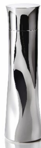
「HANDY HYDROGEN BOTTLE」

本商品は、30代～40代の働く女性や子育て世代の女性がお出かけの際でも、自宅にある整水器から生成される つくりたての電解水素水をできるかぎりそのままの状態 で飲んでいただけるよう、独自の 方法で水素が逃げにくい構造 にしました。また、 高度な金属加工技術をもつ新潟燕三条の職人によって一つひとつ丁寧に磨き上げており 、使いやすさと高級感のあるエレガントなデザインに仕上がっています。