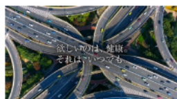
欲しいのは、健康。 それは、いつでも。

さらに、「トリムイオン Refine」の発売と同時に、新 TVCM「トリムイオン Refine 登場篇」（15 秒・30 秒）を、6 月 5 日から全国で放映します。「欲しいのは、健康。それは、いつでも」というキャッチコピーから始まるこの CM は、トリムイオン Refine をメインに置き、いつも健康を見守る浄水器の存在感を表現しています。365 日飲む水の役割は大きい、だからこそいつもの水道水が医療効果の認められた浄水器により、健康を強く意識しなくても習慣化することができる Refine の価値を伝えています。