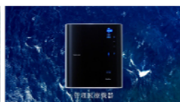
いつもの水道水が浄水から一つ上の電解水素水へ