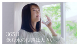
365 日飲む水の役割は大きい 電解水素水浄水器 TRIM ION Refine 新登場