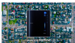
日本トリムの 電解水素水浄水器 Refine