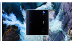
胃腸症状に効く水が知らず 知らず習慣に